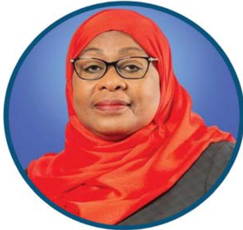
Mhe. Dkt. Samia Suluhu Hassan Rais wa Jamhuri ya Muungano wa Tanzania