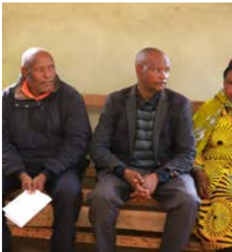
Mifumo ya Stakabali Ghalani Kupunguza Changamoto za Kilimo