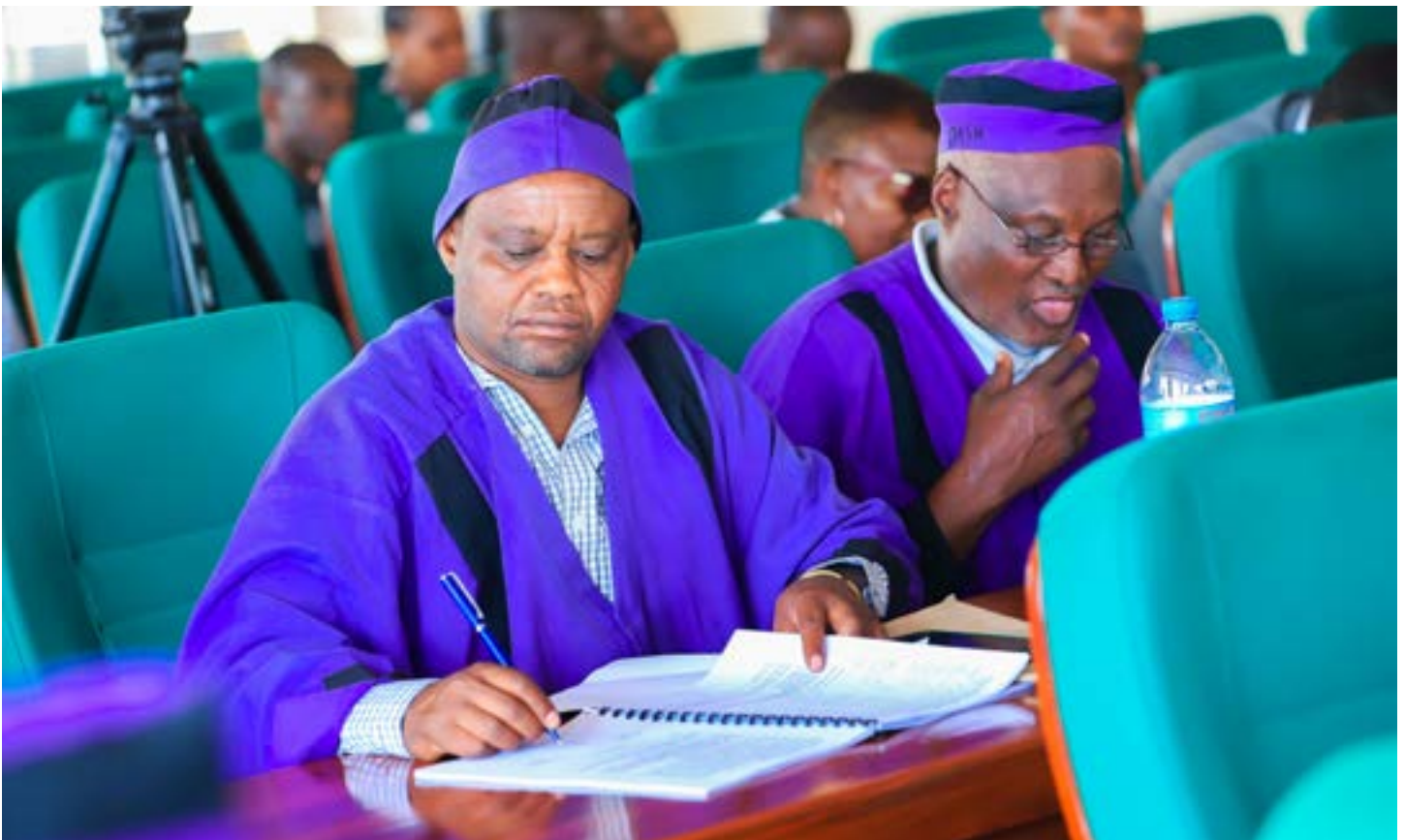
Baadhi ya Picha za Matukio katika Baraza la Madiwani Halmashauri ya Wilaya ya Babati