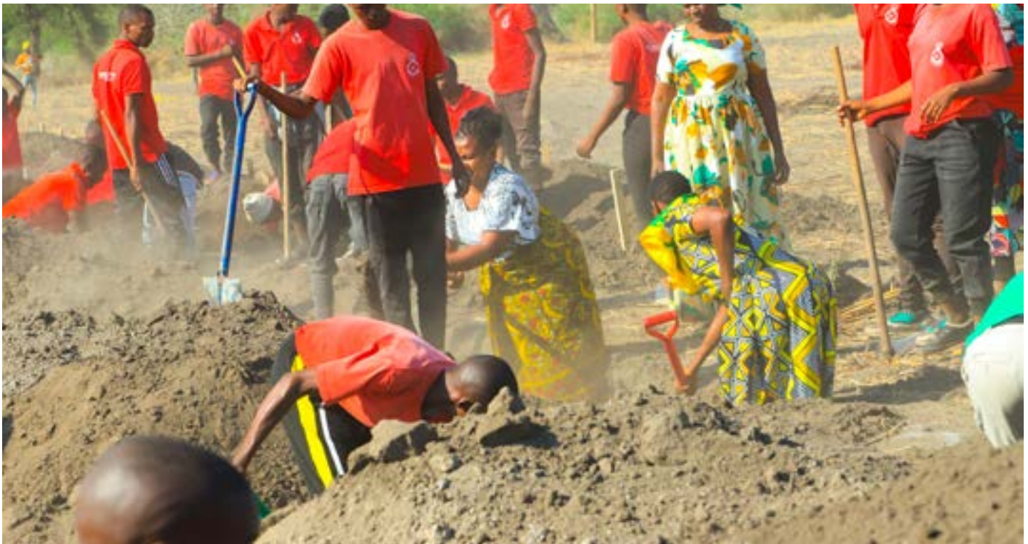
Baadhi ya Picha za Matukio Ujenzi wa Shule mpya ya Sayansi Wavulana Kata ya Mwada