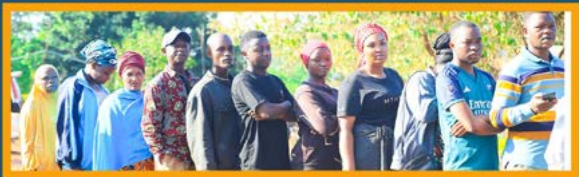
Baadhi ya Wananchi wa Wilaya ya Babati wakiwa katika Mstari wa kushiriki zoezi la kupiga kura